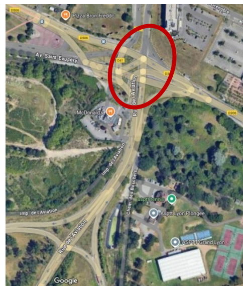
Point de blocage de l'A43

Un point de blocage majeur identifié par les cyclistes est le franchissement de l'A43 au niveau du boulevard de l'Université à Saint-Priest, actuellement jugé impraticable à vélo en raison du trafic automobile intense. De nombreux usagers choisissent ainsi de contourner cette difficulté en effectuant un détour par l'ouest via la station T2 Rebufer. Cette situation pénalise fortement la continuité et la lisibilité des itinéraires cyclables nord-sud.