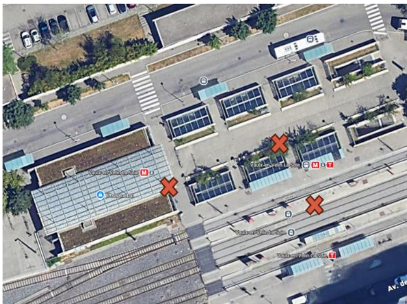
Vue aérienne du site de la rencontre

La rencontre mobile a duré 2h30 et visait à rencontrer les usagers du pôle d'échange multimodal de Vaulx-en-Velin (connexion du T8 avec le métro A, les tramways T3 et T7, la ligne Rhônexpress, ainsi que de nombreuses lignes de bus).