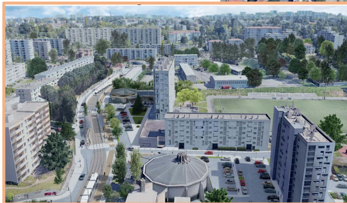
Exemple de perspective