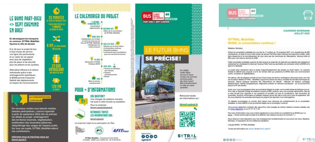
Dépliant de concertation continue et Courrier riverains

Le dépliant était également disponible sur le site Internet bhns1-sytral.fr .