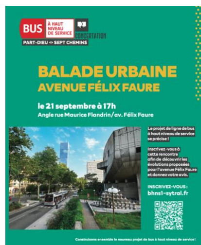
Affiche d'annonce de la balade urbaine sur l'avenue Felix Faure

Pour la plupart des rencontres des affiches ont été déposées chez les commerçants. Au total 794 affiches ont été imprimées et diffusées.