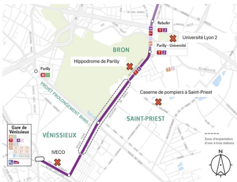
Localisation des organismes et entreprises représentés lors de l'atelier du secteur Parilly